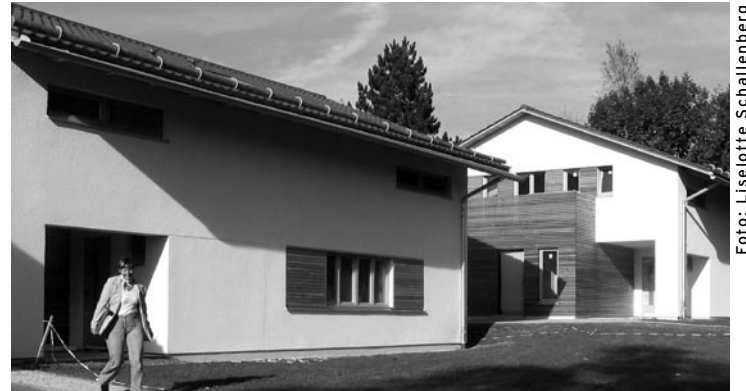
Zwei der umgebauten Ferienhäuser

Die Baukosten der gesamten Maßnahme betragen rund 3,5 Millionen Euro, von denen Bundesfamilienministerium, bayerisches Sozialministerium und Diözesan-Caritasverband jeweils ein Drittel tragen. Die drei am Wiesenweg gelegenen