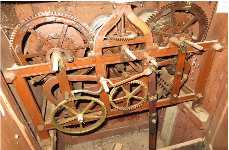
Mechanisches Turmuhrwerk , Seigendorf