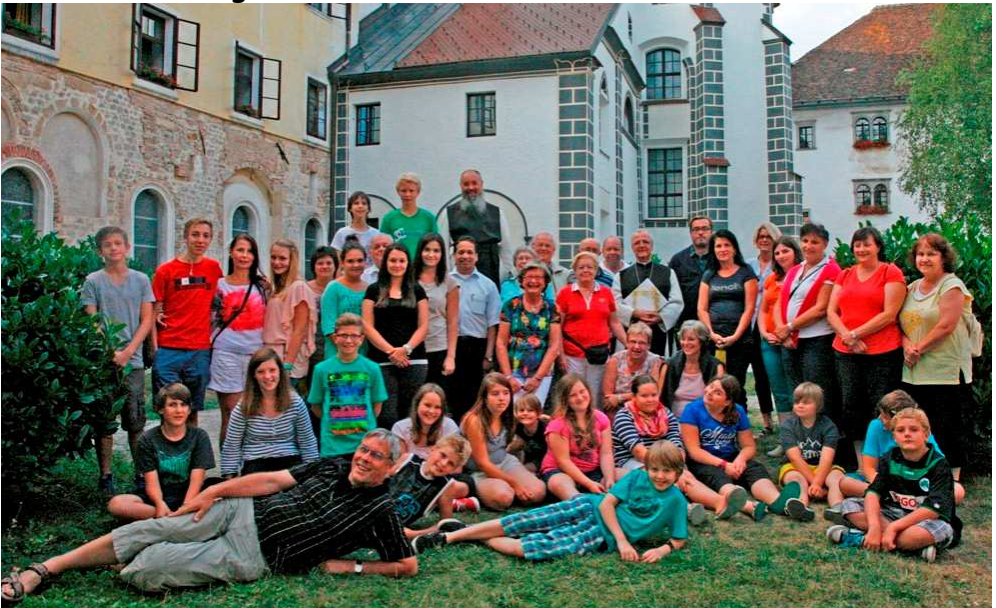
(Text: Sofia Kügel - Text und Bild: Walter Bergmann)