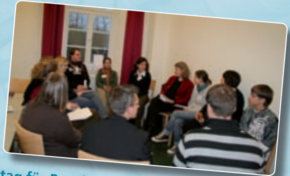
Infotag für Berufe der Kirche 1. Februar 2008