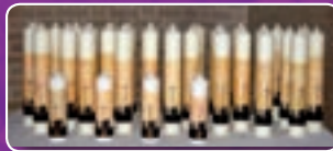
Seid meine Zeugen