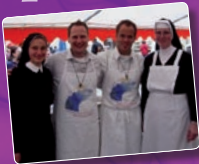
Heinrichsfest 13. Juli 2008