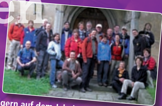
Pilgern auf dem Jakobusweg