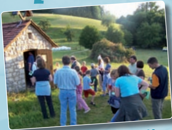
Familienwochenende 20. – 22. Juni 2008