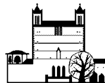
St. Karl Borromäus

Montag 9:00 - 13:00 Uhr Mittwoch 15:00 - 19:00 Uhr Freitag 9:00 - 13:00 Uhr