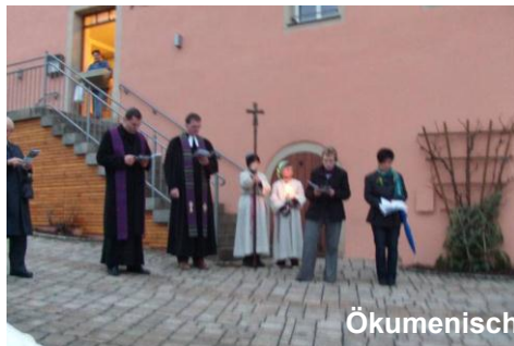
Ökumenischer Kreuzweg im Freien