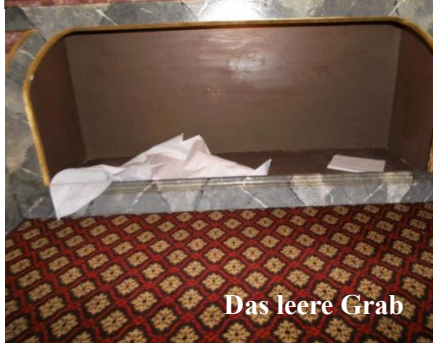
Das leere Grab