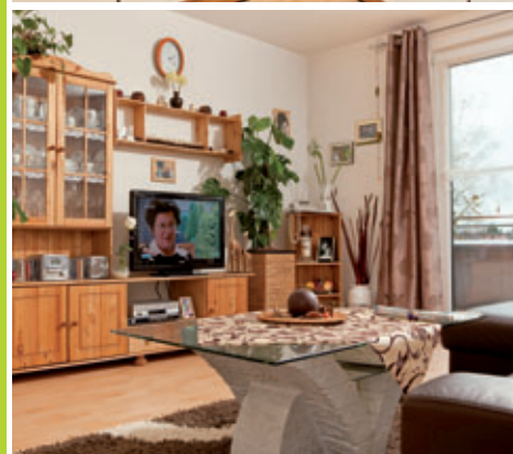
Abb. Wohnungsbeispiele, „In der Heimat wohnen“ Forchheim