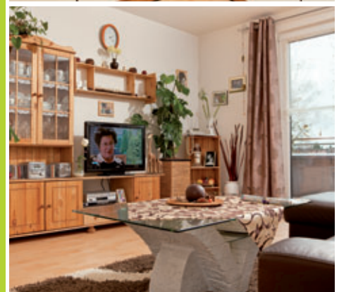
Abb. Wohnungsbeispiele, „In der Heimat wohnen“ Forchheim