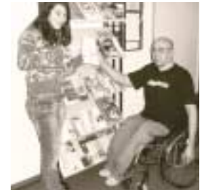
Auch im Rollstuhl kann ich anderen helfen.