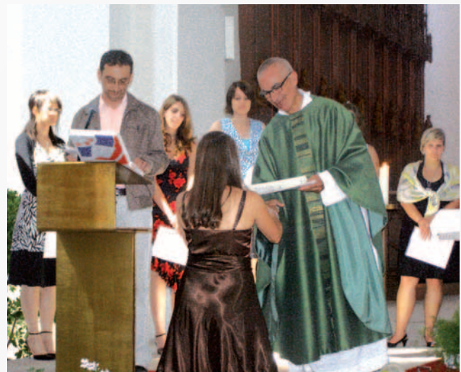
Das Religionspädagogische Zertifikat wird in einem Gottesdienst verliehen, hier ein Foto aus dem Jahr 2008.

Das religionspädagogische Zertifikat kann von interessierten angehenden und bereits ausgebildeten Erziehern/innen an den beiden Fachakademien für Sozialpädagogik erworben werden. Das geschieht durch Teilnahme an einem Seminarprogramm, in dem Themen mit besonderer Bedeutung für die religionspädagogische Arbeit theoretisch fundiert und praxisorientiert bearbeitet werden. Den Teilnehmern/innen an diesem freiwilligen Ausbildungsmodul wird dann im Rahmen eines Abschlussgottesdienstes eine Sendungsurkunde überreicht, in der es heißt: „Die Erzieherin wird beauftragt an der religiösen Erziehung von Kindern und Jugendlichen in Gemeinden und sozialpädagogischen Einrichtungen mitzuwirken.“