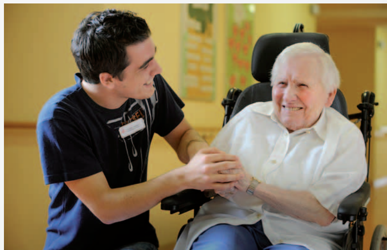
Seelsorge ist in der Altenhilfe Aufgabe jedes Mitarbeiters der Caritas.

Leider wurde die Chance verpasst, die Caritas der Gemeinde, die ohnehin schon vielerorts auf dem Rückzug war, in den