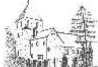
St. Antonius Mainleus