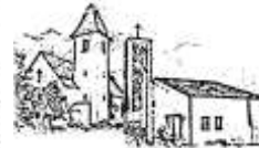
St. Marien Thurnau u. Neudrossenfeld