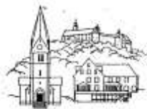
Unsere Liebe Frau Kulmbach

... im katholischen Seelsorgebereich Kulmbach Stadt und Land