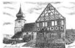
St. Maternus Motschenbach