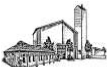
St. Hedwig Kulmbach