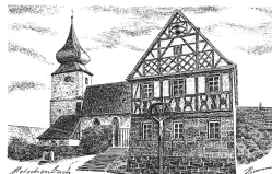
St. Maternus Motschenbach