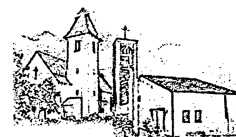
St. Marien Thurnau u. Neudrossenfeld