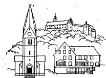
Unsere Liebe Frau Kulmbach

... im katholischen Seelsorgebereich Kulmbach Stadt und Land