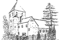
St. Antonius Mainleus