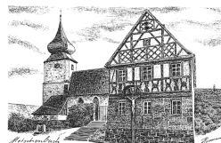
St. Maternus Motschenbach