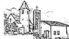
St. Marien Thurnau u. Neudrossenfeld