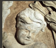
Schäden an Stuckdecke