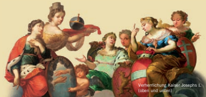
Verherrlichung Kaiser Josephs I. (oben und unten)

Kaisers Besuch: Für eventuelle Aufenthalte des Reichsoberhauptes in Bamberg ließ Lothar Franz prunkvolle Gastzimmer anlegen, darunter den berühmten Kaisersaal. Aus den bedeutungsträchtigen Bildern, die diese Räume schmücken, sprechen der gebotene Respekt vor dem Reichsoberhaupt, aber auch die traditionellen Erwartungen an die Regierung des Kaisers, die Träume von umsichtigem und uneigennützigem Handeln zum Wohle des Reichs und der katholischen Kirche. Doch auch die Todesfälle im Hause Habsburg und die Enttäuschung des Bauherrn über die eigennützige Politik Österreichs schlugen sich in der unvollendet gebliebenen Ausstattung nieder. Am Beispiel der Bamberger und anderer Kaiserräume in bayerischen Schlössern erklärt die Ausstellung die ethischen und politischen Gedanken hinter den Bildern.