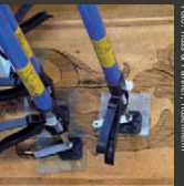
Parquet-Restaurierung Frazer Ross & Partner, Rosenheim