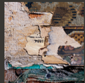
Schichten übereinanderliegender Wanddekorationen