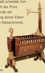
Wiege Prinz Luitpolds

Das Königreich Bayern übernahm nach der Säkularisation die weltlichen Aufgaben des Fürstbistums. Aus Rücksicht auf die Wirtschaft der Stadt wurde die Residenz weiter als Hofhaltung genutzt. Hier residierten Herzog Wilhelm in Bayern, Kronprinz Maximilian II. und Exkönig Otto von Griechenland. Zuletzt bezog das frisch vermählte Erbprinzenpaar Rupprecht und Marie Gabriele 1900 die für sie renovierten Kaiserzimmer. Damit verbanden sich große Pläne: Der zu erwartende Thronfolger sollte in Franken zur Welt kommen, um die Integration des Königreichs zu fördern. Prinz Luitpold wurde bei seiner Geburt 1901 von den Bambergern begeistert begrüßt; die Stadt schenkte ihm eine kostbare Wiege. Doch der Prinz verstarb schon vor dem Ende der Monarchie. Die Einrichtung seiner Eltern aber prägt noch heute die Kaiserzimmer.