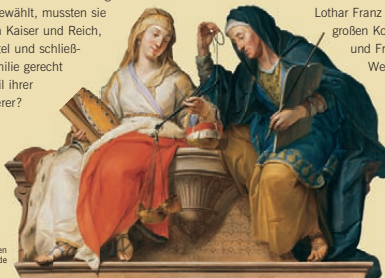
Allegorie der weltlichen und geistlichen Würde

Romanischer Dom und barocke Residenz auf dem Domberg bezeugen noch heute die doppelte Herrschaft, welche die Bamberger Fürstbischöfe ausübten: die geistliche Gewalt als Oberhirten der Kirche und die weltliche als Fürsten des Heiligen Römischen Reichs. Seit dem Dreißigjährigen Krieg standen die weltlichen Belange im Vordergrund. In der Vollendung der Neuen Residenz fand die fürstliche Macht um 1700 sinnfälligen Ausdruck. Ihr Verhältnis zum Reich spiegelte sich in den prächtigen Bildern der Kaiserzimmer. Die Ausstellung in der Bamberger Residenz informiert über die komplexe Situation der Kirchenfürsten: Nicht als Landesherren geboren, sondern dazu gewählt, mussten sie den Ansprüchen von Kaiser und Reich, Papst und Domkapitel und schließlich der eigenen Familie gerecht werden. Welcher Teil ihrer Pflichten wog schwerer?