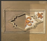
Freilegung der Plakatschicht im Leuchtenraum