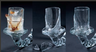
Unterhalb von Kronen sind noch alte Leuchten zu sehen. Die Schichten sind hochgestellt, fixiert und abgedichtet.