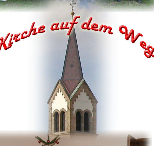
Kirche auf dem Weg