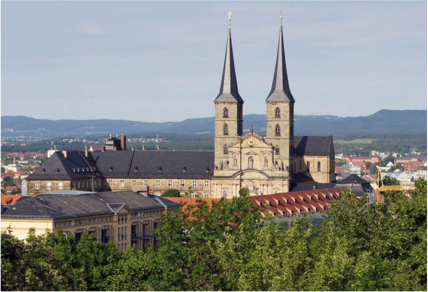
Das Grab des Hl. Otto in St. Michael, Bamberg