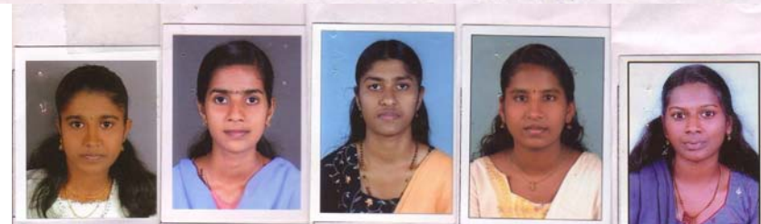
5 Mädchen aus der 4. Ausbildungsgruppe, die 2008 ihre Berufsausbildung begonnen haben.

„Verwirkliche einen Traum-Programm“, so lautet – frei übersetzt – das Motto der „Changanacherry Gesellschaft für soziale Dienste“ in Kerala. 100 sorgfältig ausgesuchte Mädchen aus allen Pfarreien Keralas in Gruppen von 25 pro Jahr durchliefen bzw. durchlaufen eine 2- bis 3-jährige Ausbildung, um mit ihrem Verdienst ihre Familie finanziell zu unterstützen. Außerdem zahlen sie von ihrem Lohn den ihnen für die Ausbildung geliehenen Betrag – soweit die Familie ihn nicht selber aufbringen konnte – zurück und ermöglichen damit die Ausbildung weiterer Mädchen. St. Josef/Weisendorf hat von 2005 bis 2008 jährlich € 7.000,- aus den gesammelten Spenden der Sternsinger über Kindermission zur Verfügung gestellt und so das Projekt mit ermöglicht.