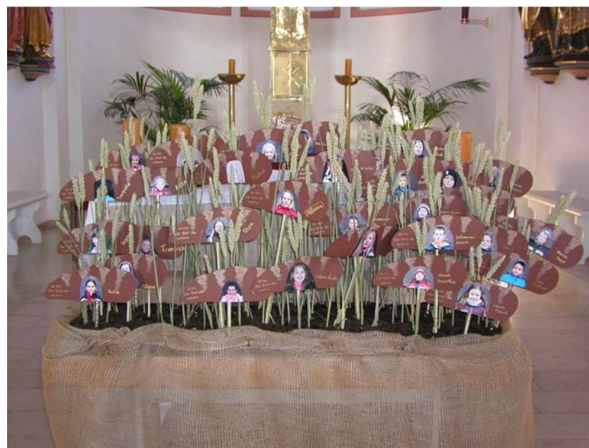
Gestaltete Vorstellung der Kommunionkinder

Christian Lauger, Pastoralreferent Verantwortlich für die Erstkommunionvorbereitung