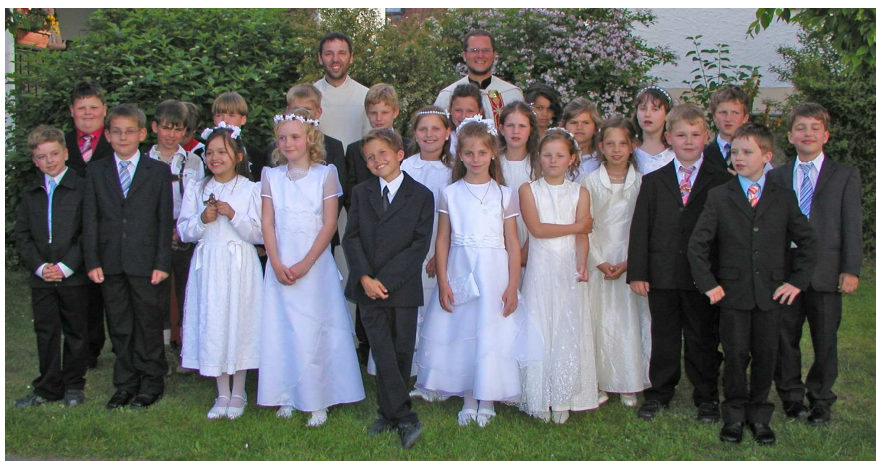
Erstkommunion am 24. Mai 2009

Am Montag nach der Kommunion führen die Kinder zum gemeinsamen Ausflug nach Regensburg und zum Kloster Weltenburg, wo in der Klosterkirche gemeinsam Eucharistie gefeiert wurde.