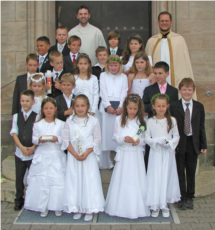
Erstkommunion am 21. Mai 2009

43 Kommunionkinder unserer Pfarrei feierten am Fest Christi Himmelfahrt (20 Kinder, siehe Foto oben) und am Sonntag darauf (23 Kinder, siehe Foto S. 7) das Fest ihrer ersten hl. Kommunion in der Pfarrkirche St. Josef. Zuvor waren sie ein halbes Jahr lang in Weggottesdiensten, Katechesen und im Religionsunterricht auf eine stärkere Freundschaft zu Jesus vorbereitet worden.