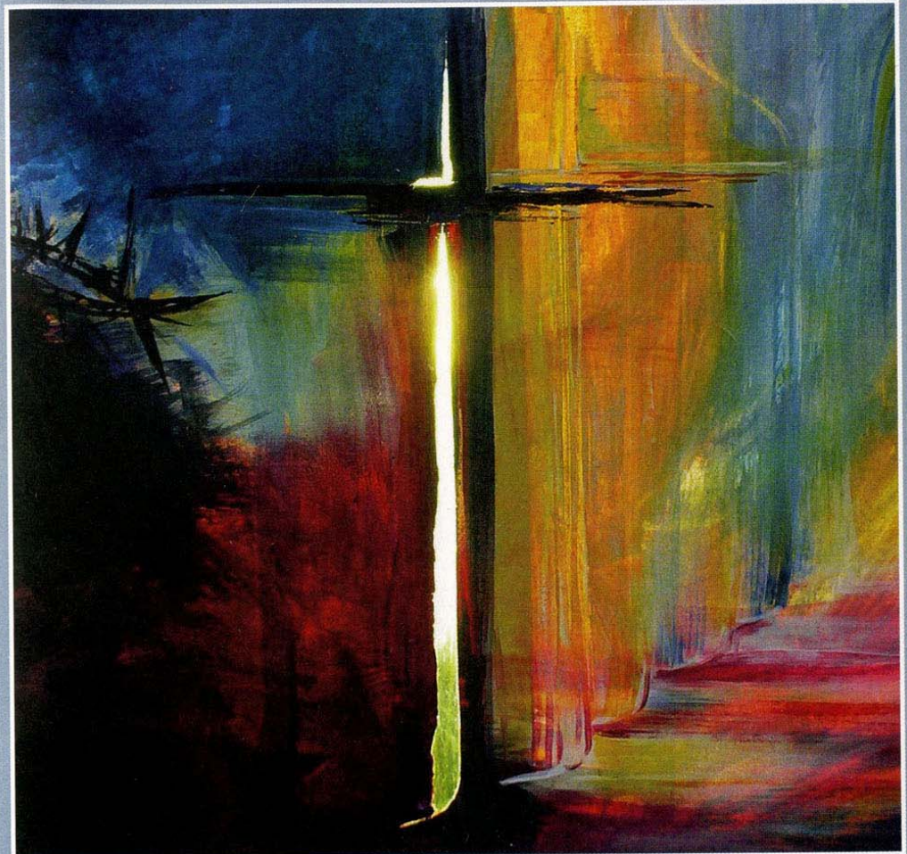
© Elke Frommhold, „Der zerrissene Vorhang“