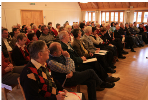
Abbildung 1: Studientag Heilsbronn

Und: Wir durften uns bei unserer Arbeit auch gegenseitig kennen und schätzen lernen: Unsere Mitglieder zeigten hohe Verlässlichkeit bei der Planung, Organisation und Durchführung von den sieben z.T. großen und öffentlichen Veranstaltungen.