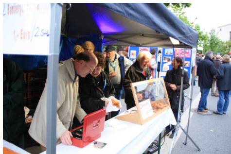
Abbildung 2: Stand am Ökumenischen Kirchentag München

Aber auch die „kleinen“ Treffen waren informativ und hilfreich: Neben Tagesaktuellem und Informationen aus dem Zentralkomitee der deutschen Katholiken diskutierten wir auch über das Themenfeld Hospizarbeit (Palliativmedizin, Patientenverfügung, Vorsorgevollmacht, Hospizbegleitung), über die assistierte Selbsttötung (aus röm.-kath., evang.-luth. und medizin-juristischer Sicht), über Gemeindepartnerschaften, Werbemöglichkeiten für den 2. Ökumenischen Kirchentag und den Generationswechsel in der Ökumene.