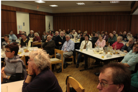
Abbildung 3: Studientag Orthodoxie

Am 17. Januar 2011 ist das konstituierende Treffen des neuen Diözesansachausschusses „Ökumene“ geplant: Sitzungsgemäß werden dann alle Funktionen und Aufgaben verteilt; auch die des Leiters steht zur Wahl. Natürlich freuen wir uns immer auf „neue Gesichter“, die an der Ökumene mit bauen wollen. Sie sind herzlich zur Mitarbeit eingeladen. Wir freuen uns auf Sie.