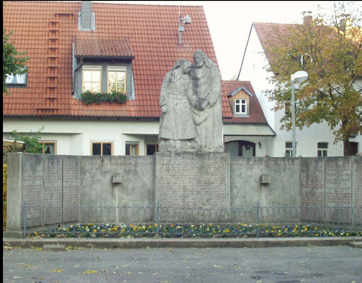
Kriegerdenkmal bei St. Josef