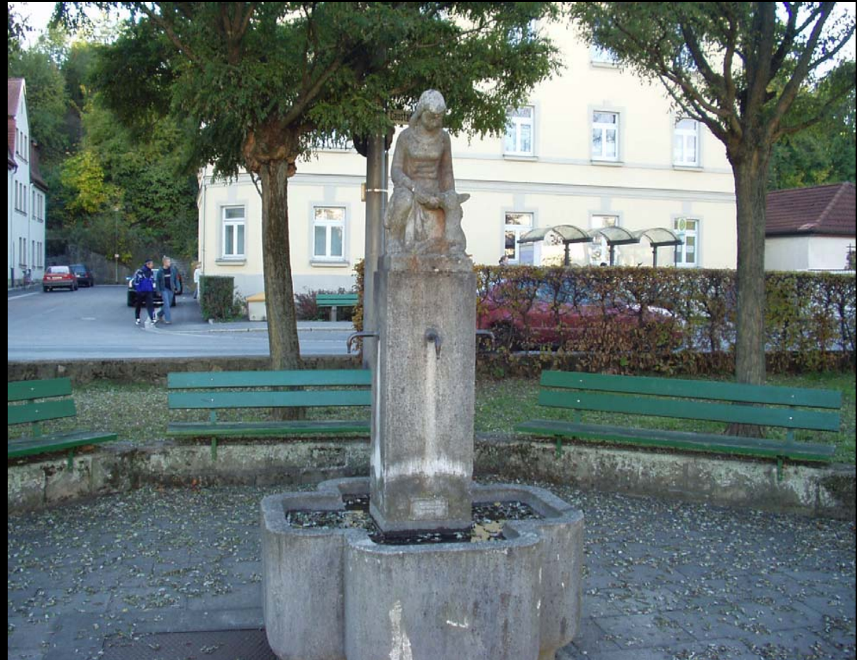
Brunnen links vor der ERBA