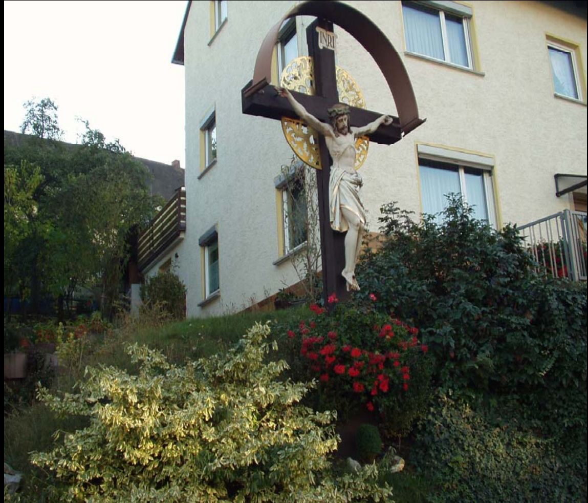
Kreuz vor Haus Loch