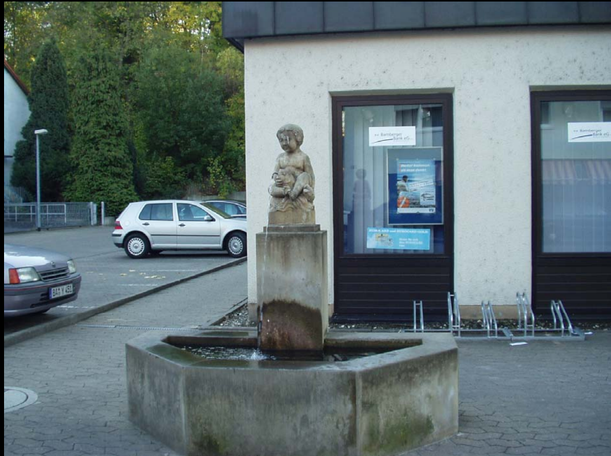
Brunnen vor der Raiffeisen-Volksbank