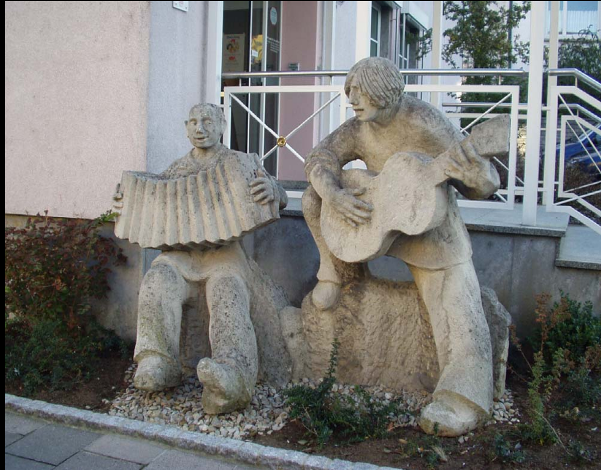
Musikantengruppe an der Sparkasse