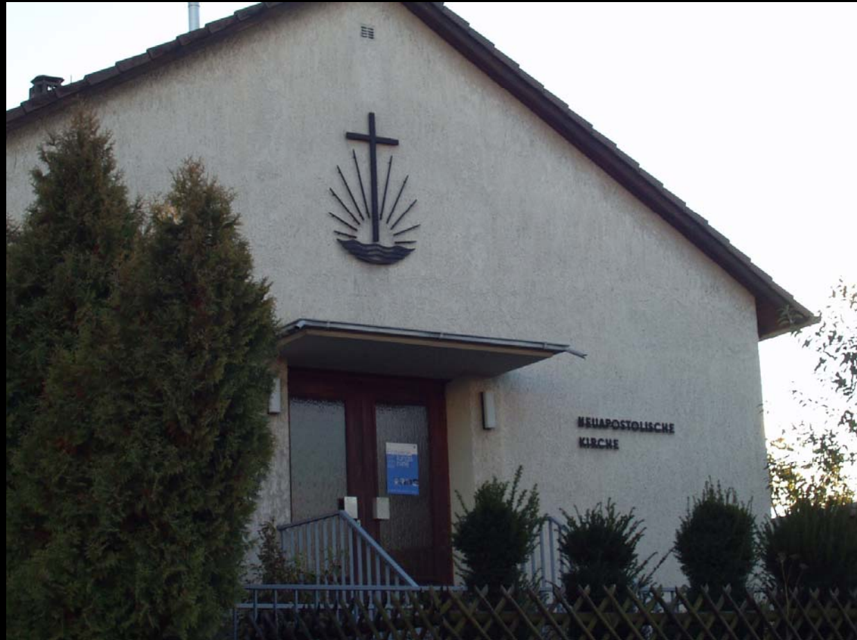
Neuapostolische Kirche, Sturzstraße