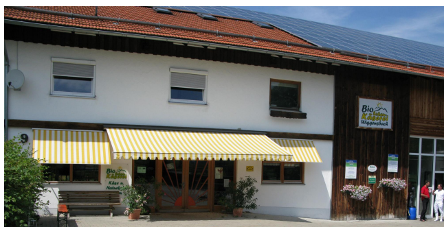
Hier werden 2,4 Mio Liter Milch jährlich verarbeitet

Die Betriebsstätte in dem Kemptener Vorort ist in einer ehemaligen Zimmerei unter Mitbeteiligung und Eigenleistung der Landwirte eingerichtet worden. –Soweit möglich stellen auch die Familienangehörigen die Arbeitskräfte. Neben einem Hofladen in Wiggensbach ist ein Vertriebsnetz aufgebaut worden www.schaukaeserei-wiggensbach.de .