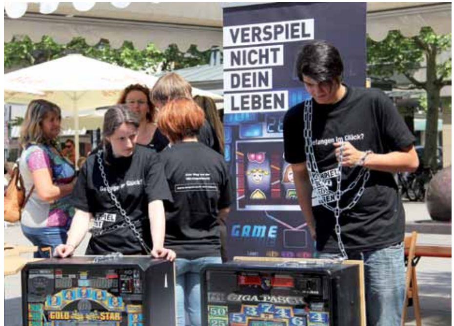
Angekettet am Spielautomat - der Aktionstag in Erlangen bot viele Aktionen zum Thema Spielsucht

Zeitgleich gab es auch in Nürnberg, Roth, Erlangen und Forchheim ähnliche Aktionen. Am Nachmittag trafen sich die Aktionsteilnehmer zentral in Erlangen auf dem Hugenottenplatz, um den zweiten Teil des Aktionstages in Angriff zu nehmen. Wir hatten einen Informationsstand mit Schautafeln und verschiedenen Mitmachaktionen aufgebaut. Unser Ziel war es, die Öffentlichkeit über die Situation von glücksspielabhängigen Menschen zu informieren und auf die Auswirkungen dieser Sucht hinzuweisen. Zwei Mit-