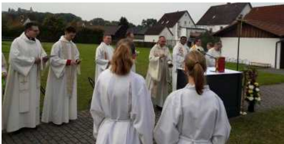
Text: Andreas Kuschbert