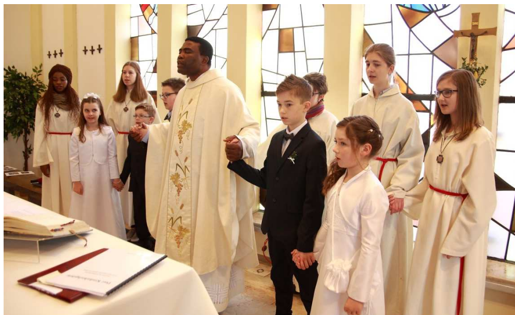
Text: Sabine Martin