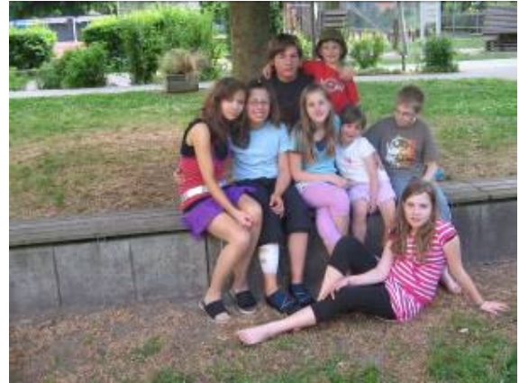
8 Kinder im Alter von 4 bis 16 Jahren