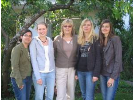
4 Vollzeiterteherinnen 1 ehrenamtliche Mitarbeiterin (links)