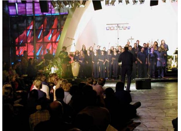
Reaching Heaven beim Finale des Band- & Chorwettbewerb