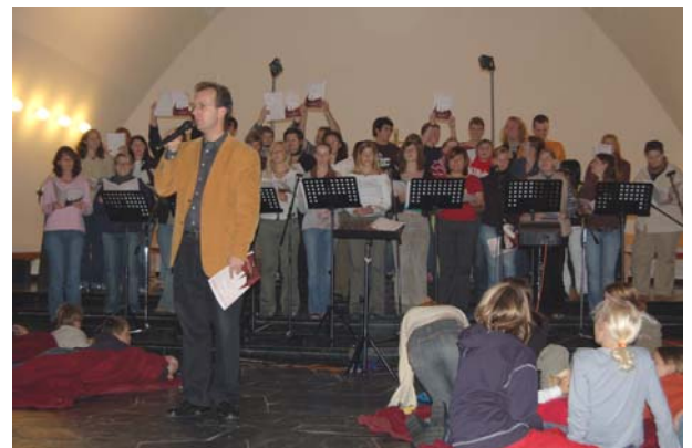
Konzert beim Festival Religiöser Lieder 2006

Und auch 2006 geht es mit viel neuem Schwung weiter mit ganz verschiedenen Angeboten rund um das NGL, die ohne die Hilfe ganz vieler Referenten, Musiker/Sänger und natürlich der Interessierten in den Gemeinden nie stattfinden könnten: von Gottesdienstgestaltungen und Band-/Chorkursen vor Ort