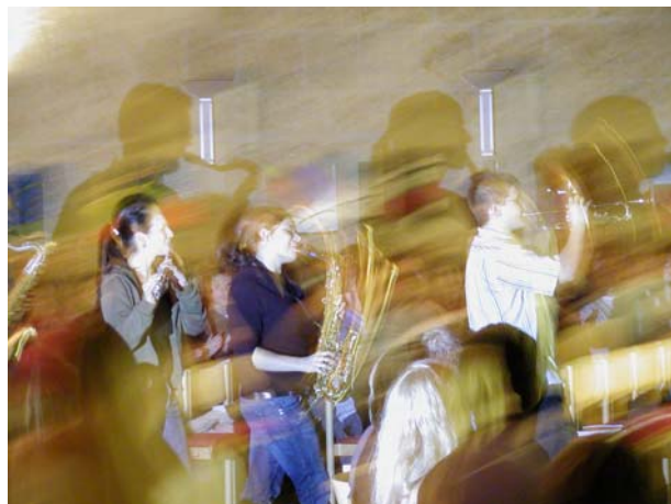
Konzert beim Festival Religiöser Lieder 2006

Nürnberg im Mai, das beliebte alljährliche große „Festival religiöser Lieder“ auf Burg Feuerstein im Oktober und ein gerade in Planung befindlicher Workshop mit Konzert, den Gregor Linßen, derzeit wohl der führende Vertreter der deutschen NGL-Szene, mit uns gestalten wird.