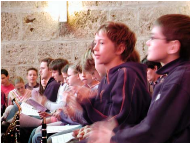
Zuhörer beim Konzert in der Oberkirche/Burg Feuerstein

Klangerlebnis pur! Mit Musik und Klang zur Ruhe kommen, aber auch Kraft schöpfen ... . An diesem Tag geht es um neue Erfahrungen mit Toncluster und Klangschalen u.ä, mit Sprechstimme (Rap), mit Dancefloorsound, – und natürlich um wohlthuende neue Lieder für Geist und Seele zu Advent und Weihnachten.