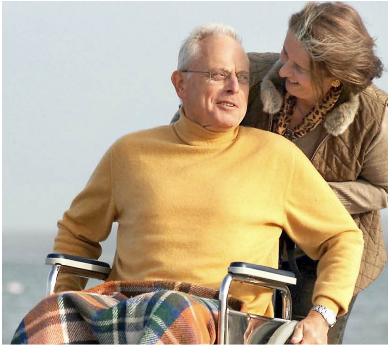
Menschen suchen im Alter suchen oft zu spät den Weg in eine Tagesstätte oder andere feste Wohnstrukturen. In vielen Fällen sind die Angehörigen aber mit der Pflege überfordert.

Deshalb sehen wir in einem Gesetz das falsche Signal. Es schiebt die Risiken einseitig den Arbeitgebern zu“, betont Brossardt. Vielmehr sei es Aufgabe der betrieblichen Personalpolitik, Vereinbarungen zu finden. Den Vorschlag der Familienministerin sieht man auch im Forchheimer Unternehmen Waasner skeptisch, weil das Gesetz für die Arbeitgeber nicht kostenneutral sei. Der Haken an dem Modell sei, dass in der 50-prozentigen Phase noch eine halbe Arbeitskraft eingestellt werden müsse, gibt Geschäftsführer und IHK-Vizepräsident