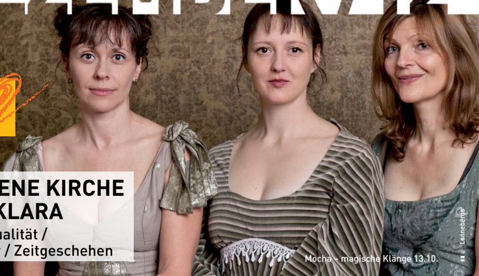
Mocha – magische Klänge 13.10.

OFFENE KIRCHE ST. KLARA Spiritualität / Kultur / Zeitgeschehen