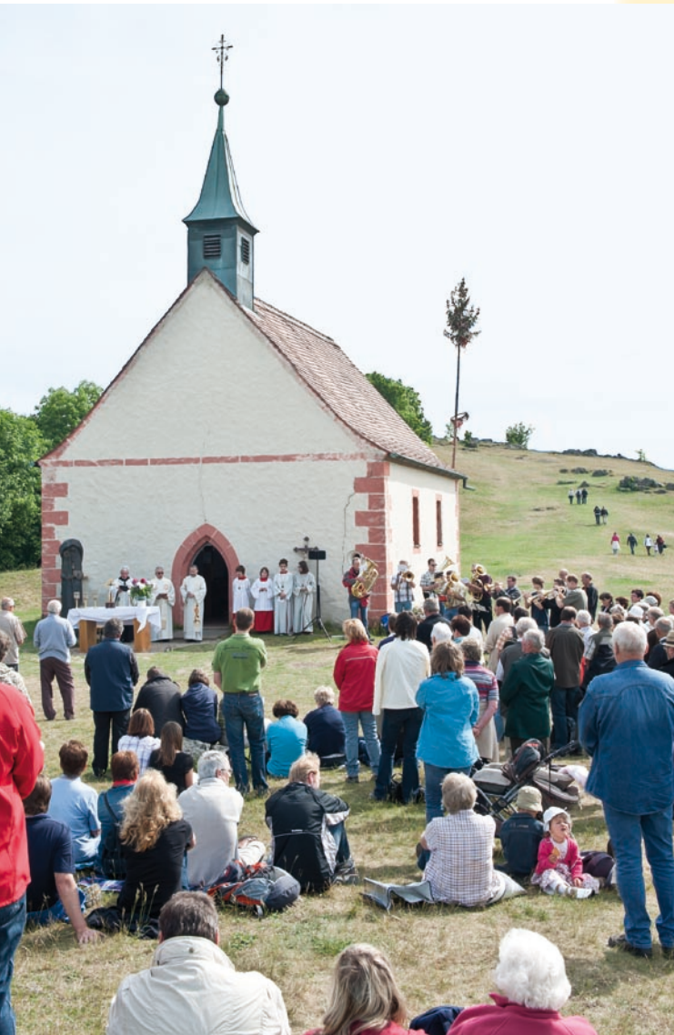
Die Walpurgiskapelle steht auf der Nordkuppe des „Walberla“ in der Fränkischen Schweiz zwischen Forchheim und Ebermannstadt.