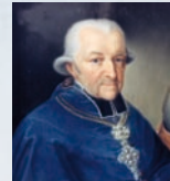
Joseph Graf von Stubenberg, 1. Bamberger Erzbischof.

■ 1802/03 Säkularisation des Hochstifts Bamberg. Fürstbischof Christoph Franz von Buseck verliert seine weltliche Herrschaft, Klöster werden aufgelöst. Die Bayern bringen den Domschatz nach München.