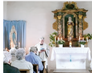
Gottesdienst im Marienmonat Mai.