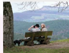
Reizvoll: Rast am Veitsberg mit Blick auf den Staffelberg.