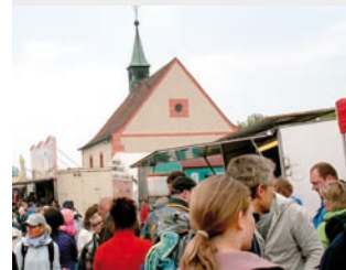
Menschenmassen strömen zum traditionellen Kirchweihfest.