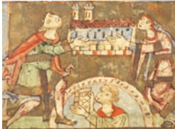
Heinrich und Kunigunde mit dem Dommodell.