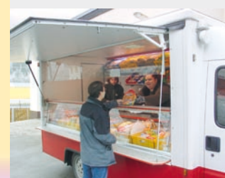
Engagiert: Die Caritas betreibt und unterstützt Lebensmitteltafeln für bedürftige Menschen.