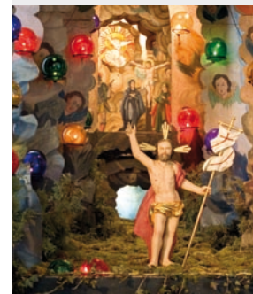
Vielbesucht: das Heilige Grab in der Kar- und Osterzeit.