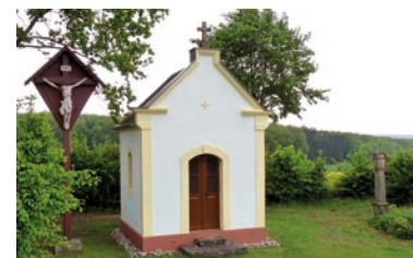
Malerisch gelegene Kapelle bei Pretzfeld.