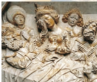
Tod Kaiser Heinrichs II., Relief am Grabmal im Bamberger Dom.