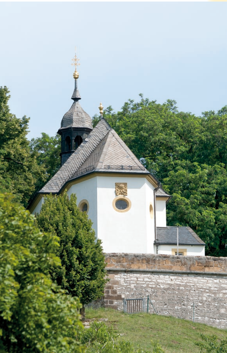
Die Georgskapelle thront auf knapp 400 Höhenmetern nördlich des Ortes Gunzendorf auf dem Senftenberg.

Weithin sichtbar zieht in der Nähe von Buttenheim die Senftenbergkapelle die Blicke der Vorbeifahrenden auf sich. Hervorgegangen ist sie aus einer Burgkapelle der Edelfreien von Schlüsselberg. Die jetzige Kirche wird 1668/69 nach den Plänen des Baumeisters Valentin Juliot erbaut.