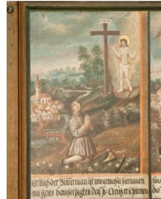
Darstellung der legendenhaften Auffindung des Holzkreuzes.