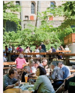
Bier und Brotzeit im Schatten der Kapelle.