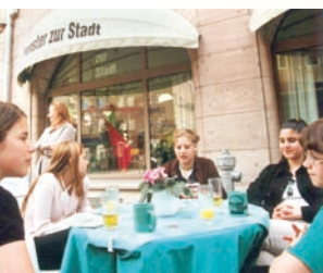
Offen für alle: Café der Katholischen Stadtkirche Nürnberg.