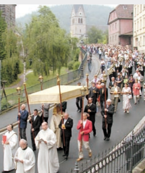
Traditionsbewusst: Fronleichnamsprozession in Kulmbach.