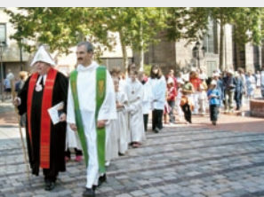
Demonstrativ: Ökumenischer Gang durch Nürnberg.

Das Erzbistum Bamberg begegnet den Anforderungen der heutigen Welt auf viele Arten. Rund zwei Millionen Menschen leben in dem Gebiet zwischen Frankenwald und Oberpfalz. Mehr als ein Drittel davon bekennt sich zum katholischen Glauben. In der Großstadt Nürnberg bietet die City-Seelsorge offene Angebote auch für Kirchenferne an. In den ländlichen Gebieten ist die katholische Volksfrömmigkeit noch lebendig und findet in Wallfahrten und Prozessionen ihren Ausdruck. Um eine flächendeckende Seelsorge zu gewährleisten, sind die Pfarreien in 96 Seelsorgebereiche vernetzt. Rund 3000 ehrenamtliche Mitarbeiterinnen und Mitarbeiter engagieren sich als Lektoren oder Organisten, in der Kirchenverwaltung oder in Aktionskreisen.