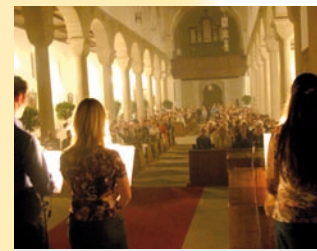
Atmosphärisch: „Nacht der Bibel“ in Bamberg.

In der Partnerschaft mit der Diözese Thiès im Senegal, mit zahlreichen Projekten von kirchlichen Verbänden und Gemeinden und 34 ehrenamtlich betriebenen Läden manifestiert sich der Gedanke von der „Einen Welt“.