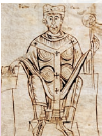
Älteste Darstellung von Bischof Otto.

■ 1007 Gründung des Bistums Bamberg am Allerheiligentag auf Initiative Heinrichs II. Von Anfang an steht Bamberg in einem besonderen Schutzverhältnis zu Rom.