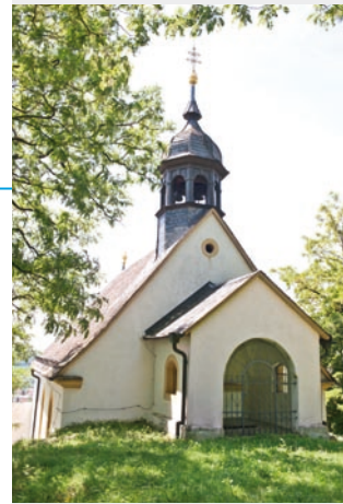
Bereits um das Jahr 1000 stand an dieser Stelle eine Burg.