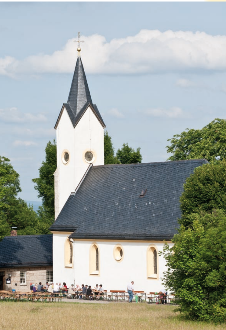
Schweißtreibend, aber lohnend: der Fußmarsch von Staffelstein oder Löffeld zum „heiligen Berg der Franken“.