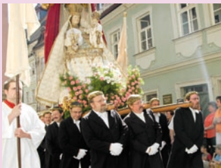
Ludwig Schick Erzbischof von Bamberg

A handwritten signature in black ink that reads "Ludwig Schick". The signature is written in a cursive style with a large, stylized 'L' and 'S'.