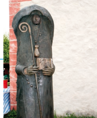
Ernst Steinacker schuf die Walpurgisfigur vor der Kapelle.

Kontakt: Kath. Pfarramt St. Matthäus, Hauptstraße 20, 91369 Wiesenthau, Tel. (0 91 91) 9 72 73