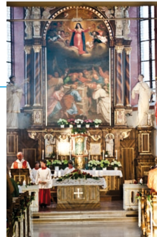
Ein beliebter Wallfahrtsort und eine angefragte Hochzeitskirche.

Kontakt: Katholisches Pfarramt St. Kilian, Wilhelm-Spengler-Straße 3, 96110 Scheßlitz, Tel: 09542/92 10 88, Fax: 09542/92 10 89, E-Mail: pfarramt@pfarrei-schesslitz.de