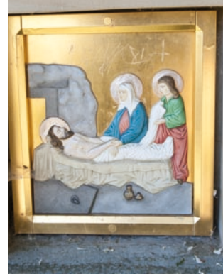
Über einen steilen Fußpfad führt der Kreuzweg zur Kapelle.