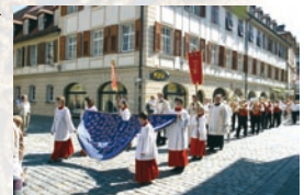
Ein „Sternenmantel“ zieht 2007 als spirituelle Stafette durch das Bistum.