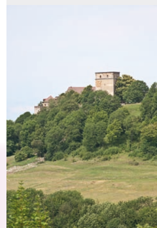
Die renovierte Giechburg – vom Gügel aus gesehen.