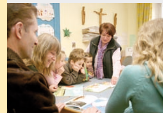
Innovativ: Kindergarten in Coburg als Familienstützpunkt.