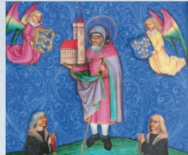
Dedikationsseite mit dem hl. Sebaldus.

■ 1425 Auf Betreiben der Nürnberger wird der Einsiedler Sebald heilig gesprochen.