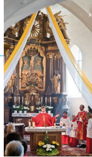
Ein Höhepunkt im Kirchenjahr – Gottesdienst zum Kreuzbergfest.

Kontakt: Katholisches Pfarramt Pautzfeld-Hallerndorf, Pautzfelder Str. 28, 91352 Pautzfeld-Hallerndorf, Tel. 09545/8252; Fax: 09545/7400