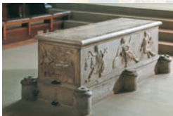
Grabmal des Papstes Clemens II. im Dom.