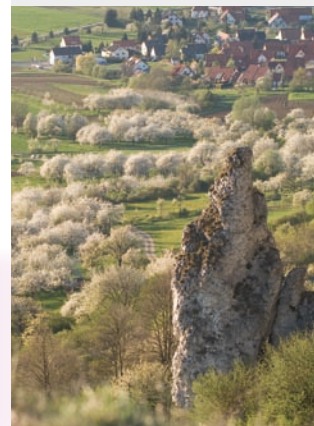
Seit 1987 ist die Ehrenbürg Naturschutzgebiet.