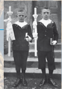
Kommunionkinder zu Beginn des 20. Jhs.

■ 2007 Im Jahr des 1000-jährigen Bistumsjubiläums gibt es in der gesamten Erzdiözese „Unterm Sternenmantel“ viele liturgische, soziale und kulturelle Veranstaltungen und Akzente.