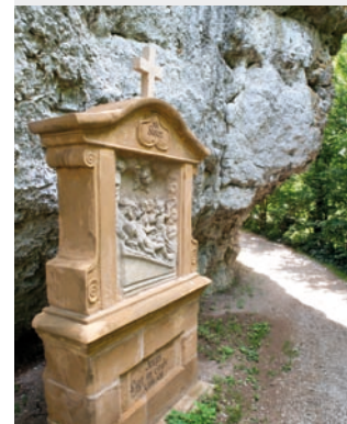
Ein historischer Kreuzweg führt von der Giechburg zum Gügel.