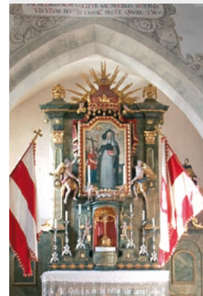
Kunstfertig: Hochaltarbild der hl. Adelgundis von 1788.