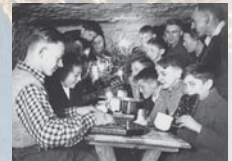
Heimliches Treffen der Donjugend in der NS-Zeit.