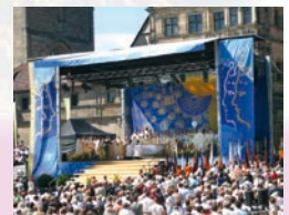
Festgottesdienst beim Heinrichsfest 2007 mit Kardinal Wetter.