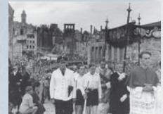
Fronleichnamsprozession im zerstörten Nürnberg 1947.