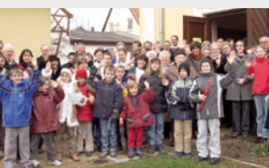
Beeindruckend: Mitarbeiterteam der Pfarrei Bad Windsheim.