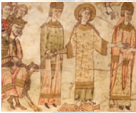
Pflugscharprobe der hl. Kunigunde, 13. Jh.