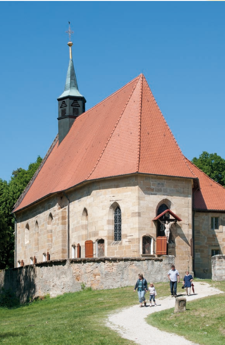
Die Kapelle am Kreuzberg ist mit dem Auto gut von Schnaid oder Hallerndorf zu erreichen.

Schon seit vielen Jahrhunderten steuern fromme Pilger den Kreuzberg bei Hallerndorf an. Bis zu 23 Wallfahrten ziehen in der Blütezeit an einem Tag hinauf auf den Hügel im Forchheimer Land. Bereits 1430 ist hier eine Kapelle nachgewiesen. 1463 wird sie durch das jetzige Gotteshaus ersetzt. An ihren Außenwänden befinden sich stichbogige Nischen für die 14 Kreuzwegstationen und – als Besonderheit – eine 15. Station mit der legendenhaften Darstellung der Kreuzauffindung durch Kaiserin Helena.