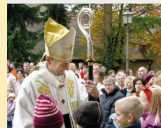
Vorbildhaft: Erzbischof Dr. Ludwig Schick hat eine Stiftung für kinderreiche Familien gegründet.