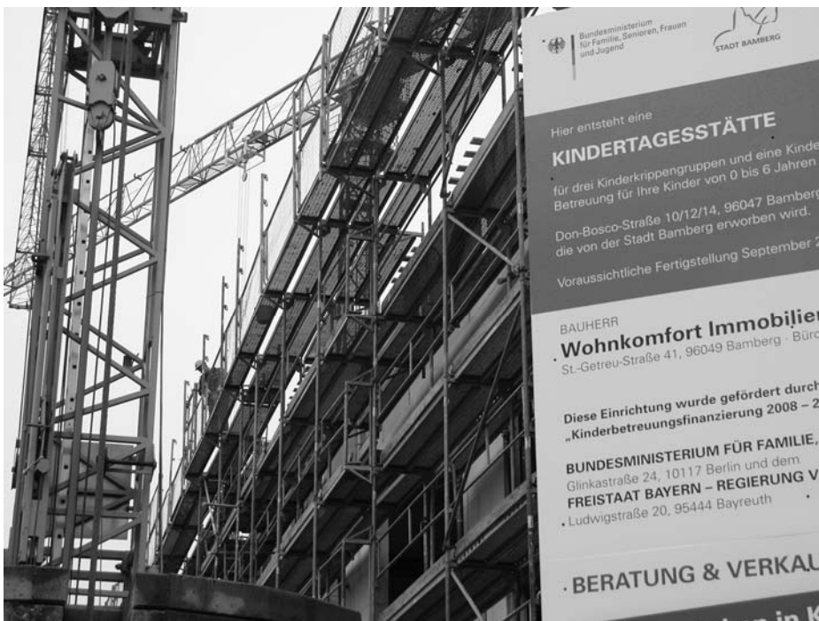
Das Gebäude Don-Bosco-Str. 10/12/14 mit seinen geplanten 24 Eigentumswohnungen wird zukünftig auch Gruppen der Kindertagesstätte St. Martin beherbergen wird.

Der Rohbau, dessen Erdgeschoss die Stadt Bamberg der Kirchenstiftung St. Martin als neue Kindertagesstätte zur Betriebsträgerschaft überlassen wird, wächst und gedeiht. Die Übergabe ist zum 29. Juni 2011 geplant. In jedem Fall zum neuen Kindergartenjahr ab September 2011 werden dort eine Kindergarten-Gruppe und die drei Krippengruppen einziehen. Das Provisorium in der Mußstraße wird überflüssig, die beiden Kindergartengruppen in der Kleberstraße bleiben bestehen. Dennoch wird es auf dem Inselgebiet auch in den nächsten Jahren an Kindergartenplätzen mangeln.