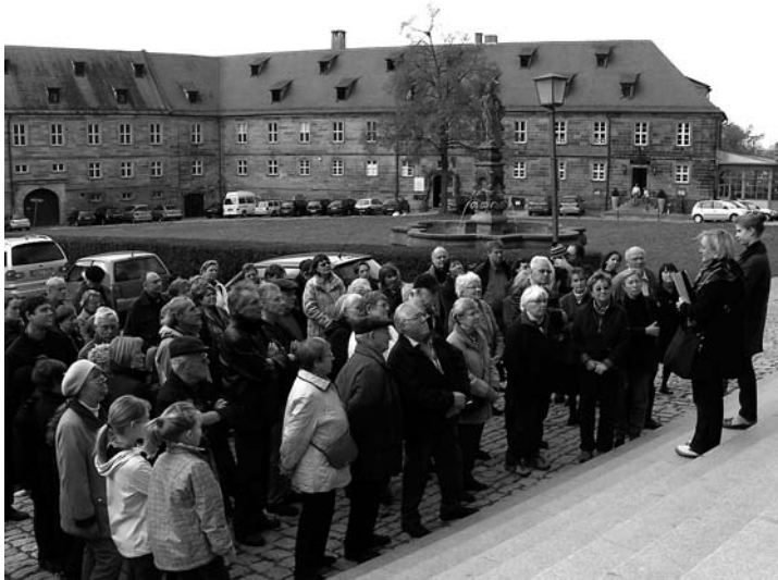
Über 70 Ehrenamtliche der Pfarrei kamen zum diesjährigen Aktivendank und unternahmen unter fachkundiger Führung einen kulturhistorischen Spaziergang rund um St. Michael.