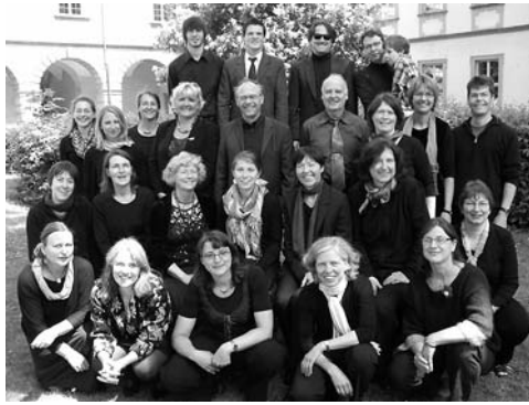
Der junge Chor

So hat sich über die Jahre ein abwechslungsreiches Standardrepertoire von ca. 60 Stücken aufgebaut, das überwiegend geistlichen und liturgischen Charakters ist. Es wird stetig erweitert und umfasst ebenso internationale weltliche Musik.