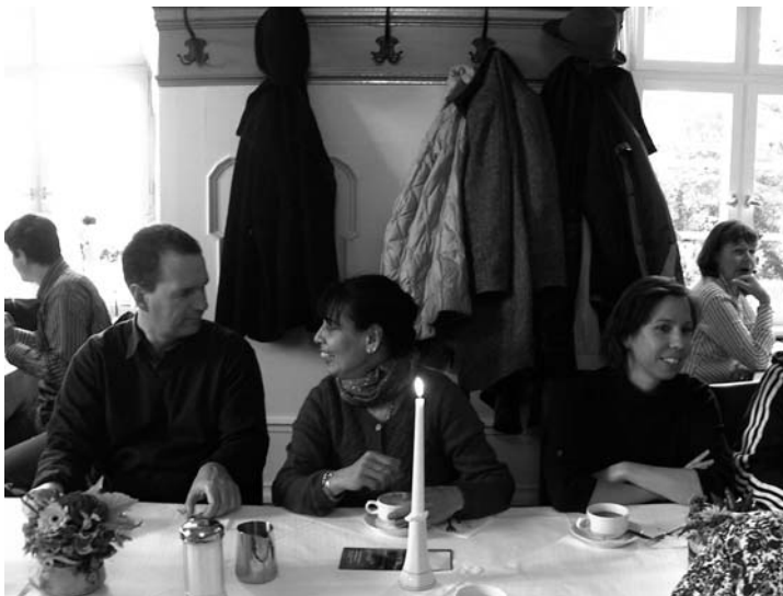
Zeit zu Austausch und Gespräch.