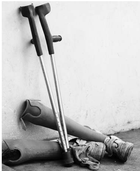
Krücken und Prothesen sind in Kambodscha für Menschen mit einer Gehbehinderung keine Selbstverständlichkeit.